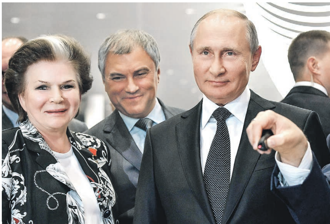
АЭРОПОРТ ГАГАРИН стал хорошим вкладом в развитие транспортной инфраструктуры страны, сказал ВЛАДИМИР ПУТИН . В аэропорту президента сопровождали спикер Госдумы ВЯЧЕСЛАВ ВОЛОДИН и депутат ВАЛЕНТИНА ТЕРЕШКОВА

«Саратовцы ждали строительства аэропорта с 80-х годов, но затем случившиеся события в стране, кризисы не позволили это сделать, — говорил спикер Госдумы Вячеслав Володин во время рабочего визита в Саратовскую область в августе. — Несколько лет назад это решение было реализовано благодаря поддержке нашего президента. Именно к нему в 2009 году мы обратились с просьбой поддержать решение о строительстве меж-