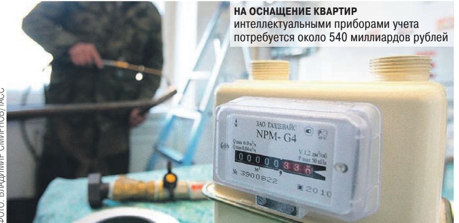
НА ОСНАЩЕНИЕ КВАРТИР интеллектуальными приборами учета потребуются около 540 миллиардов рублей

Первое, что надо сделать, — перенести ответственность по установке приборов с потребителя на поставщика, то есть на сетевую