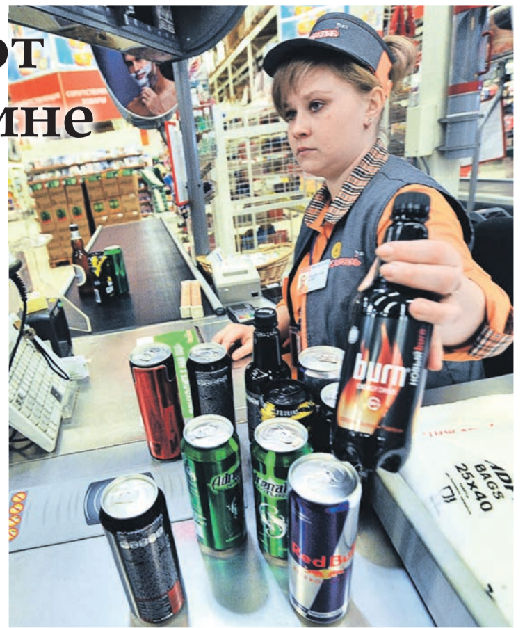
В МИРЕ ПРОДАЖА АЛКОГОЛЬНЫХ ЭНЕРГЕТИКОВ уже запрещена — в США с 2010 года, в Европе — с 2015 года.