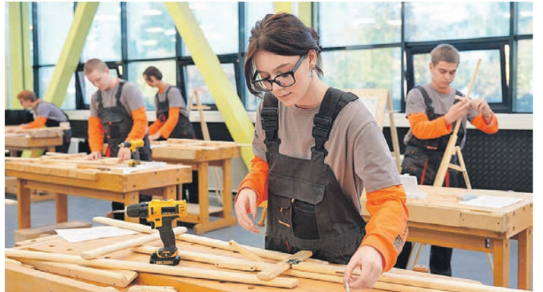
В БЛИЖАЙШИЕ СЕМЬ ЛЕТ СТРОИТЕЛЬНОЙ ОТРАСЛИ ПОНАДОБИТСЯ 669,5 тысячи новых сотрудников для замены выбывающих специалистов

Еще один важный проект, способный насытить строительный рынок кадрами, — создание по поручению зампреда Правительства Марата Хуснулина центра подготовки госслужащих,